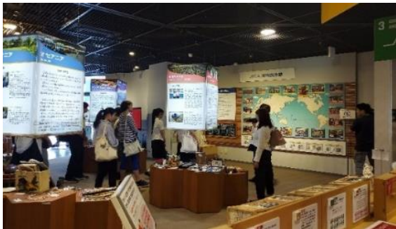
JICA関西（フィールドパビリオン体験）