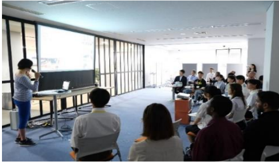
留学計画・フィールドパビリオン体験発表