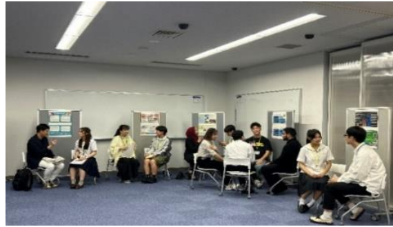
アドバイザー等との意見交換会