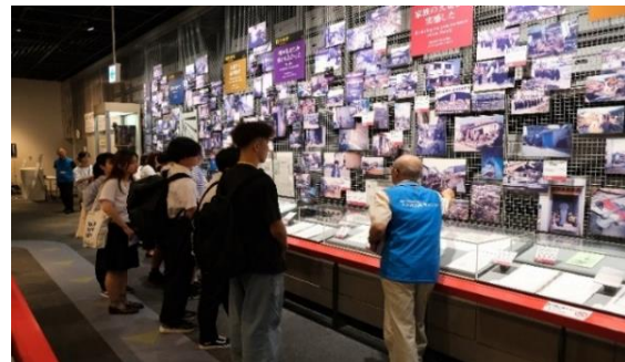
人と防災未来センター（フィールドパビリオン体験）