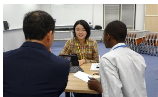
ご寄附をいただいた企業の皆様、アドバイザー等と高校生の交流会